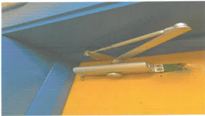
2층 유스5실 도어클로저 교체