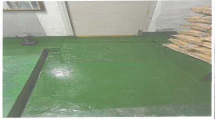
기계실 후문 앞 부분도색