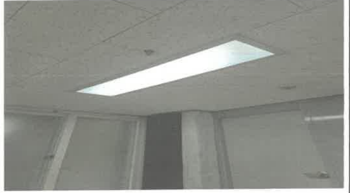
기사대기실 전등 설치