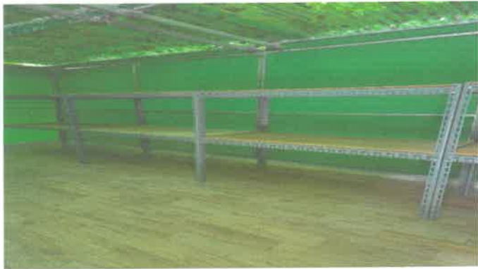
대체육관 후문쪽 창고 앵글선반 제작