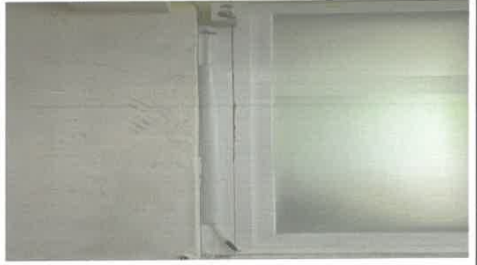
1층 평교 에어컨 드레인호수 유인작업